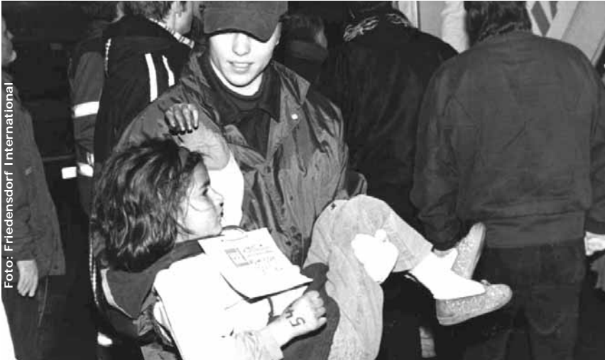
Ankunft am Flughafen Düsseldorf

Dem FRIEDENSDORF wurden von den afghanischen Eltern sehr viele verletzte Mädchen anvertraut. Ein Zeichen sehr großen Vertrauens, denn wer die muslimischen Verhältnisse kennt, weiß von den Schwierigkeiten, die Eltern haben, Mädchen für unbestimmte Zeit in eine fremde Welt zu entlassen. Selbst die Regierungsübernahme der Taliban bewirkte hier keine Änderung.