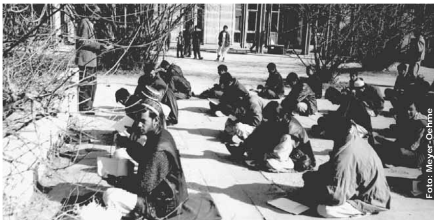
Nachprüfung am Lycée Esteqlal, März 2002.

Im Fernsehsessel daheim konnten Sie teilhaben an der großen Eröffnungsfeierlichkeit in der Mehrzweckhalle der Amani-Oberrealschule. Haben Sie beobachtet, wie unsicher sich die Pfadfinderinnen in der entschützenden Uniform fühlten? – „Back to school!“ – „Open your books!“ Die Türken haben jetzt 8 Elitelymnasien in Afghanistan eingerichtet. Der Sender ARTE informierte in Europa über die Aktivität der Franzosen, über das Engagement der „Grande Nation“ für ihre Kabuler Schulen. An beiden, dem Lycée Esteqlal (Jungen) und dem Lycée Malalai (Mädchen) wurde mit einem Heer von Arbeitern Tag und Nacht gearbeitet. Es gelang! Der französische Außenminister kam persönlich zur Wiedereröffnung in alter Pracht. Zehn französische Lehrer werden (an jeder der beiden Schulen) unterrichten.