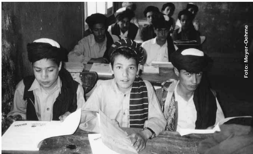
Schüler der Amani-Oberrealschule, Mai 2001

Die europäische Fremdsprache, welche die Schüler ab Klassenstufe 7 lernen, ist traditionsgemäß Deutsch. Generell ist in Afghanistan Englisch die Fremdsprache Nr. 1. An allen Schulen wird zudem Arabisch gelehrt.