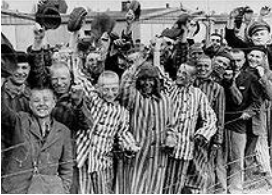
Gefangene bei der Befreiung des KZ Dachau

Sonntag, 29. April: die Amerikaner sind da. Um 17.00 Uhr ist das KZ Dachau befreit, ein ergreifendes Ereignis. Noch bevor sie den Häftlingsbereich befreien, treffen die Amerikaner ohne jede Vorwarnung oder Ahnung auf den Eisenbahnzug mit den unzähligen erschossenen und verhungerten Häftlingen. Den ersten Eindruck dieses Eisenbahnzuges beschreiben einige US-Soldaten später als extrem schockierend und verstörend. Voller Entsetzen und Wut über die schrecklichen Zustände kommt bei US-Soldaten die Flüsterparole „Hier machen wir keine Gefangenen!“ auf. Aufgrund der schrecklichen Zustände im Lager kommt es seitens der US-Soldaten und ehemaligen Häftlinge zu Übergriffen und zur Ermordung von SS-Männern. Später wird dies als Dachau-Massaker bekannt.